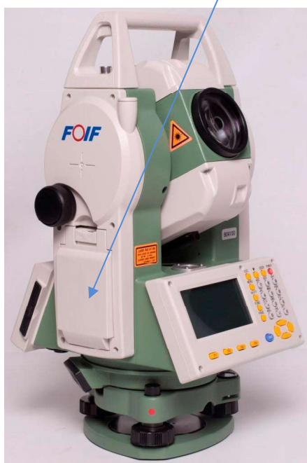
г) Модификация RTS332