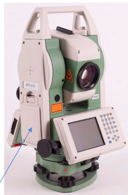
в) Модификация RTS010