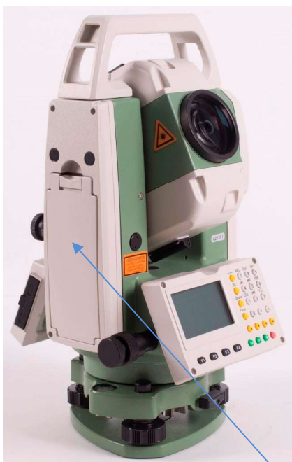
а) Модификация RTS102