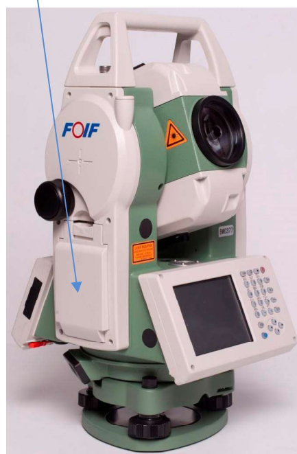
д) Модификация RTS362