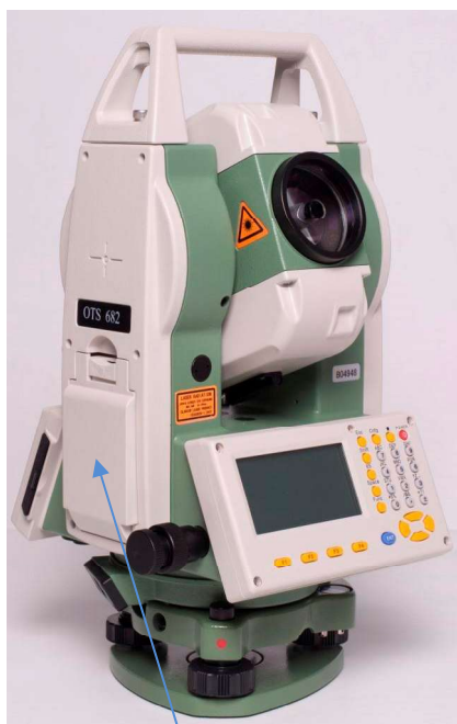
б) Модификация OTS682